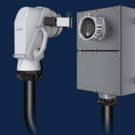
CONNECTEUR AVEC POIGNÉE COUDÉE SUR SOCLE DE PRISE