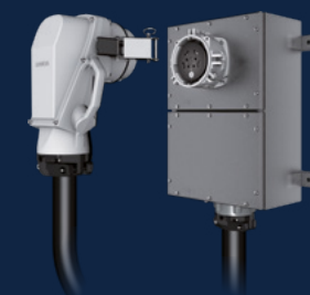
CONECTOR CON EMPUÑADURA ACODADA EN BASE